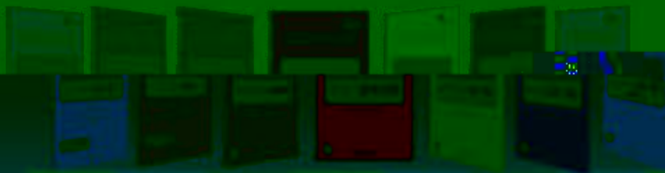
八度 度 度 度 度 度 度 度 度 度